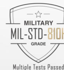
Multiple Tests Passed

Châssis conçu à partir de plastique de consommation recyclé afin d'offrir des produits respectueux de l'écologie.